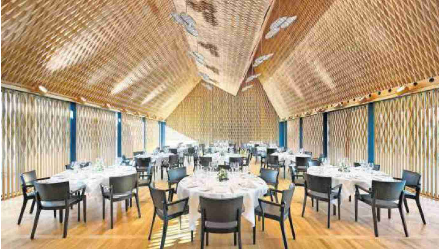
Kernstück des Saals sind die 20 000 pyramidalen Elemente.

Beim nationalen Prix Lignum 2024 von Holzwirtschaft Schweiz glänzt ein Freiamter Projekt in der Kategorie Schreinerarbeiten.