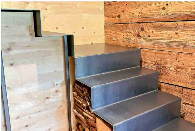
Die blanke Stahl terrasse harmoniert mit dem neuen und alten Holz.