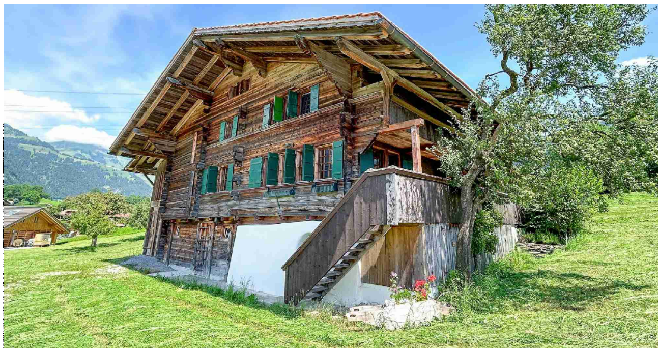
Seit fast 400 Jahren an Reinisch heimisch: Das «Hubelhuus»-Bauernhaus ist heute ein zeitgemäss eingerichtetes Wohnhaus.