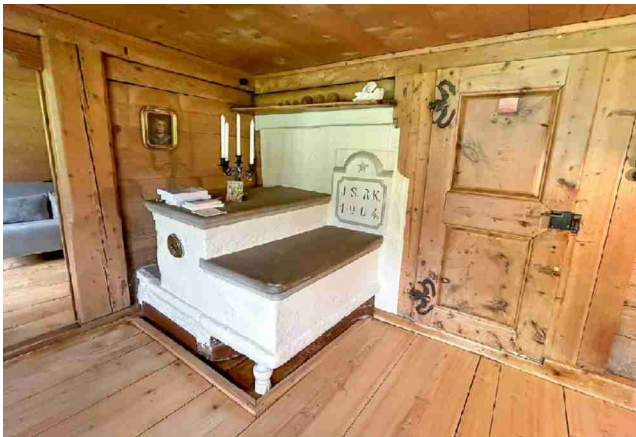
Der Sitzofen im Esszimmer wird durch einen alten Holzkochherd in der Küche erwärmt.