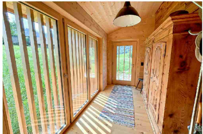
Statt eines baufälligen Schopfes ein neues Entree, rechts ein restaurierter Holzschrank