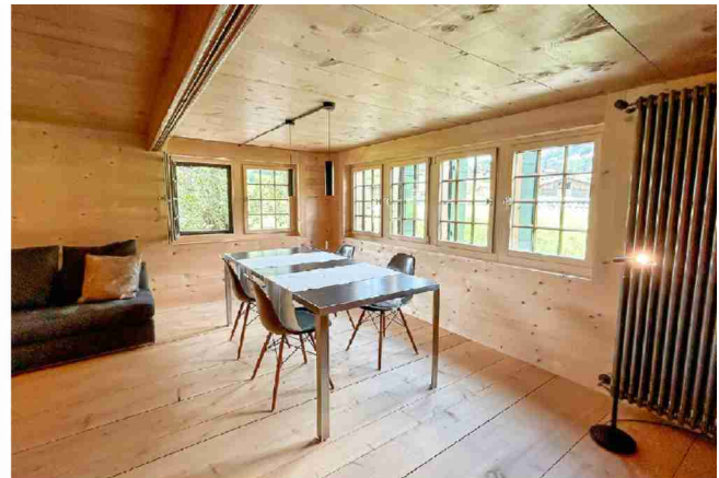
Das Esszimmer in der früheren Stube mit nachgebauten, isolierten, kleinteiligen Fenstern