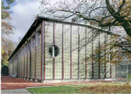
Gold Holzbauten: Wiederverwendbare Sportbauten, Zürich ZH.