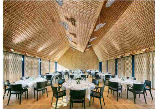
Schreinerarbeiten Gold: Drei-Häuser-Hotel «Caspar», Muri AG.

Bauherrschaft: Stadt Bulle; Architektur: RBCH, Bulle; Holzbauplaner: Gex et Dorthe, Bulle; Holzbau: Groupe Grisoni – Dougoud Constructions bois, Epagny. Label Schweizer Holz für Gesamtobjekt.