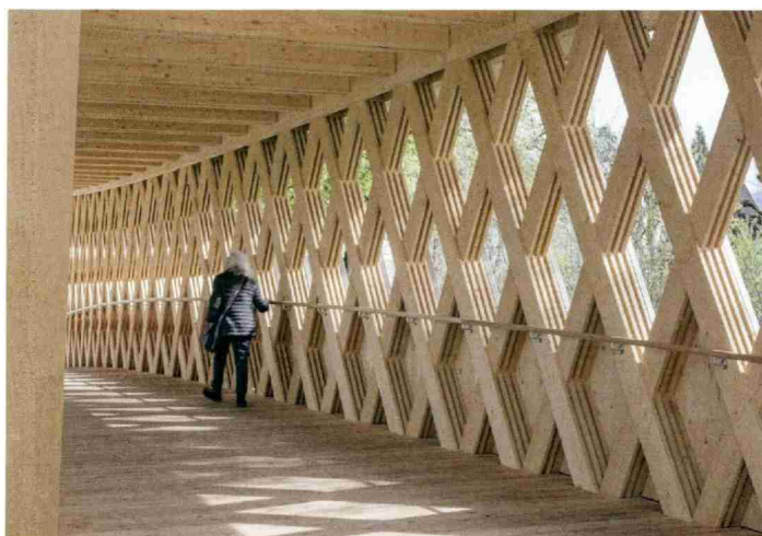
Bronze Holzbauten: Passerelle des Buissons, Bulle FR.

Bauherrschaft: Hochbauamt Kanton Zürich und Amt für Hochbauten Stadt Zürich; Architektur: pool Architekten, Zürich; Holzbau- und Brandschutzingenieure: Makiol Wiederkehr, Beinwil am See; Holzbau: Blumer Lehmann, Gossau (kantonale Bauten)/Schäfer Holzbautechnik, Dottikon (städtische Bauten).