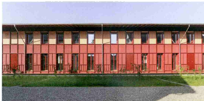
Silber Holzbauten: Pappelhöfe Wohnkolonie im Hard, Langenthal BE.

Gold gibt es in der Kategorie Holzbauten für kreislauffähige Sportbauten in Stadt und Kanton Zürich . Sie sind demontierbar und reaktionsfähig, klug konstruiert und spielerisch schön – Holzbau in Höchstform. Das modulare Prinzip erlaubt Konfigurationen mit einer oder zwei Turnhallen und Nebenräumen. Anstatt – wie im Modulbau üblich – Böden, Decken und Wände unnötig aufzudoppeln, dienen Zwischenräume als Entrée oder Flur. Die allerorts zugänglichen Schraubkonstruktionen und bisweilen ausgefuchste Details wie die flächenbündig verschraubten Doppelstützen der Turnhallen ebneten einem unbeschädigten Rückbau den Weg. Aussen präsentieren sich die Provisorien angenehm leichtfüssig. Je nach Ort lassen sich die Aussenstützen und Latten in verschiedenen Farben streichen.